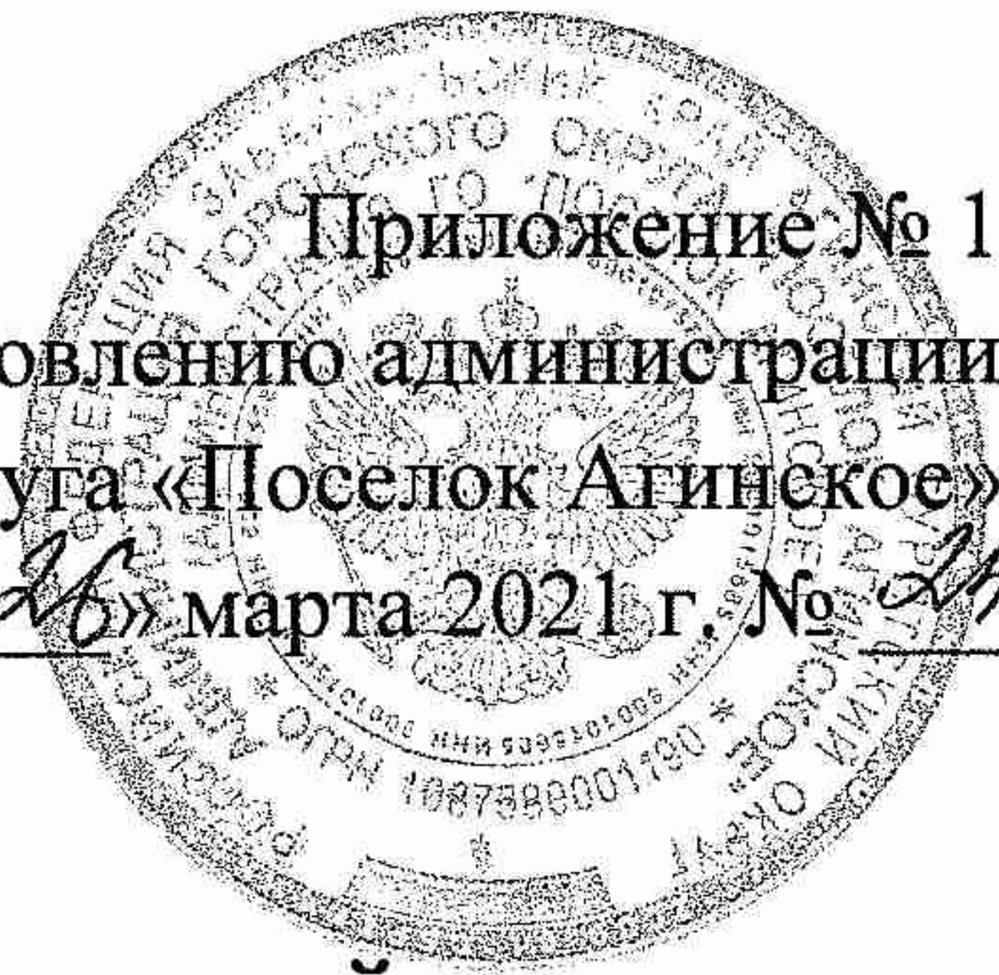
График проведения Месячника правовых знаний в общеобразовательных организациях ГО «Поселок Агинское», ГАПОУ «Агинский педагогический колледж им. Базара Ринчино»

Приложение № 1 к постановлению администрации городского округа «Поселок Агинское» от « 26 » марта 2021 г. № 242